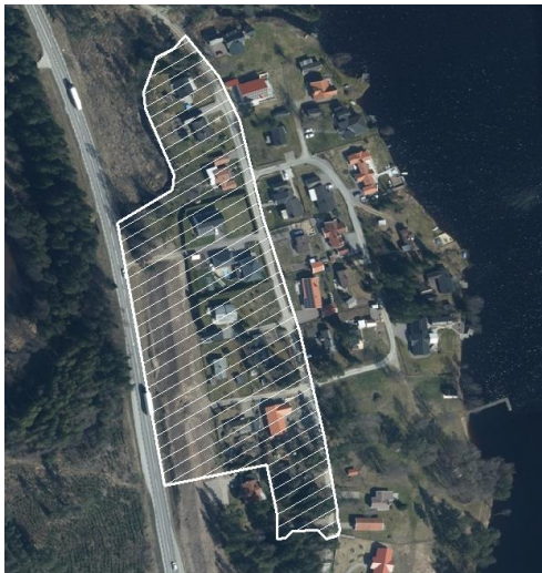
Berört område är markerat med vita sträck. 1:2000, Ortofoto Lantmäteriet 2023.

Planområdet är beläget i nordvästra Sjöatorp och är 21 676 m 2 .