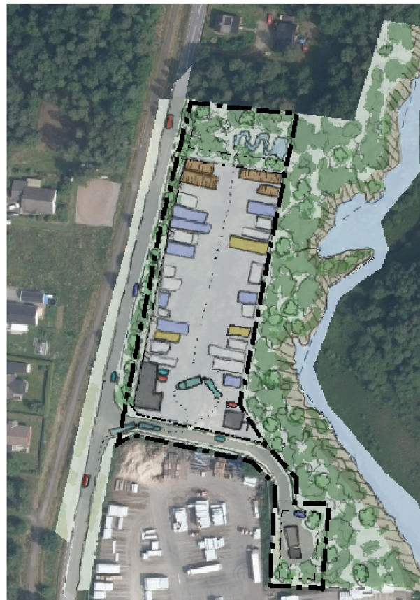
Illustration ovan ortofoto av ett potentiellt genomförande