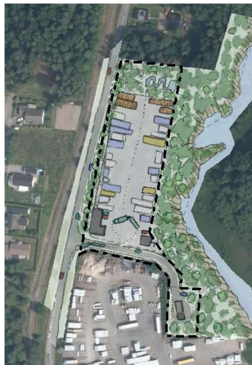
OBS! Endast illustration av en möjlig utformning.