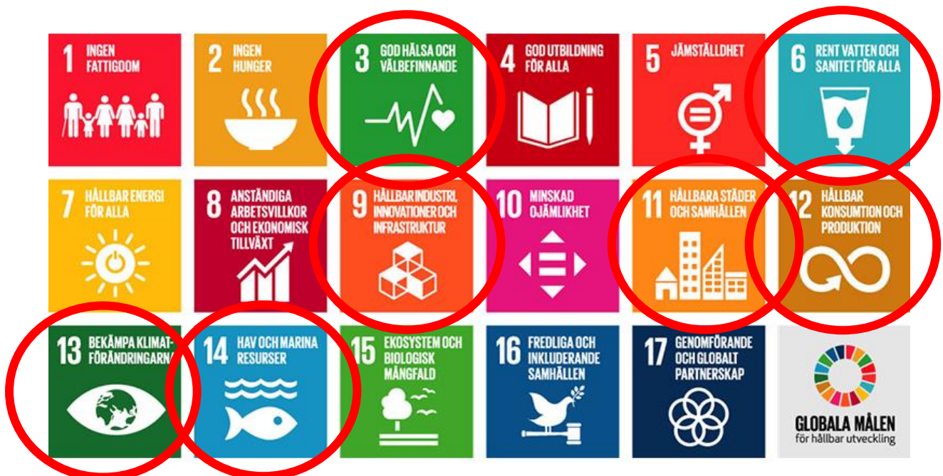
Figur 3.1–1 Globala mål som berör avfallsplanen