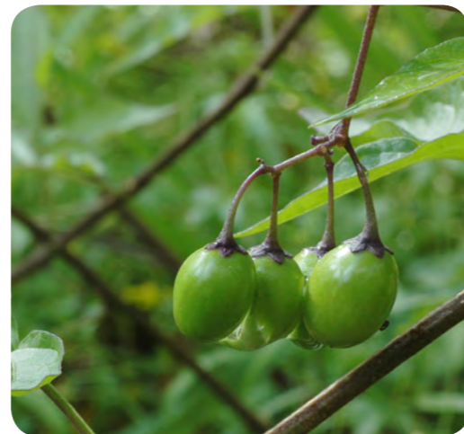
Bär på besksöta