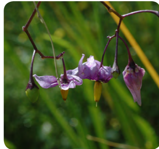
Blommor på besksöta