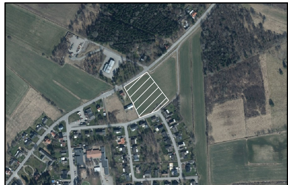
SKALA 1:10 000